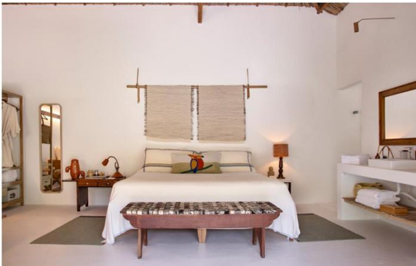
As suítes primam por delicadeza na ambientação e nos serviços

A premissa foi respeitar ao máximo as características da construção local, trazendo objetos carregados de regionalismo e peças contemporâneas assinadas. "Desejamos contar uma história muito maranhense", diz Marina. A escolha dos materiais foi pautada pela regionalidade: tons de areia brincando com a cor das dunas, toques de cor para trazer alegria e cerâmicas e palhas que traduzem o artesanato da região. "Brincamos com o modernismo e com peças de design bem brasileiro. As cadeiras em couro e ferro remetem a uma criação da Lina Bo Bardi; já as de franja, em palha de buriti, são da designer Neca Abrantes. Também usamos peças garimpadas e artesanato de criativos regionais."