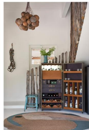
Marina Linhares valorizou as características da construção local e o regionalismo