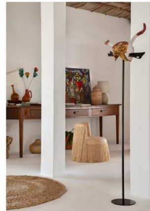
Foram utilizados mobiliários e peças de arte e design brasileiros a partir de uma pesquisa focada na região

Está aí um paraíso e uma iniciativa empreendedora linda de ver e conhecer, de bater palmas à simplicidade brasileira que pode sim ser sofisticada. É o nosso Brasil ganhando mais valia!